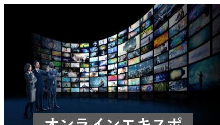
オンラインエキスポ